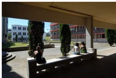
A passagem da Universidade a fundação vai ser votada pelo Conselho Geral da UM a 31 de Maio (Paulo Ricca)

A Federação Nacional de Professores (Fenprof) afirmou hoje estar "contra" a passagem da Universidade do Minho a fundação, considerando esta uma "forma perversa" para dar o "pontapé de saída" na privatização da instituição.